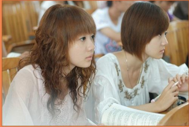
广西经济管理干部学院党委宣传部